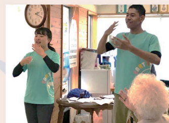
ボランティア活動