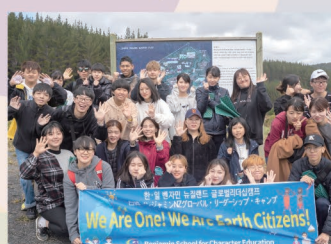
グローバルリーダーシップキャンプ