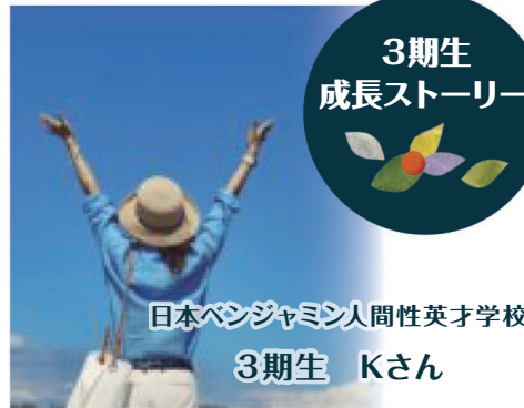
日本ベンジャミン人間性英才学校 3期生 Kさん

しまう日々がしばらく続きました。その24時間をどのように使えばいいのかわからなかったのです。